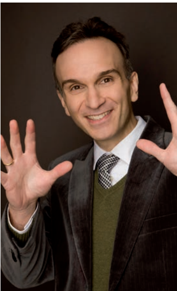
Gil Shaham 23.01. OPL / Krivine / Shaham

Ins Reich der Mitte, ohne dafür die Strapazen eines Interkontinentalflugs auf sich zu nehmen? Das bislang wohl exotischste «Adventure+»-Konzert macht's möglich! Comment se rendre dans l'Empire du milieu en s'évitant un vol transcontinental? Avec le plus exotique des concerts «Adventure+», c'est possible.