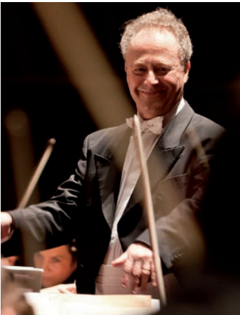
Emmanuel Krivine 08.01. «Neijoersconcert» / OPL / Krivine

Du romantisme à l'état pur: le Concerto pour violon de Mendelssohn et la dernière symphonie de Bruckner par l'OPL et la célèbre violoniste américaine Gil Shaham.