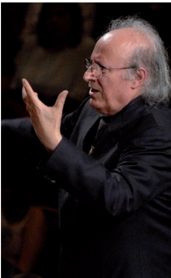
Eliahu Inbal 24.04.

«Mahlers Musik wirkt auf mich wie eine Bibel.» Werden Sie Ohren- und Augenzeuge, wenn Eliahu Inbal sich der Exegese von Mahlers Sechster widmet! «La musique de Mahler me fait l'effet d'une bible.» Soyez-en le témoin oculaire et auditif lorsqu'Eliahu Inbal se consacrera à l'exégèse de la Sixième de Mahler!