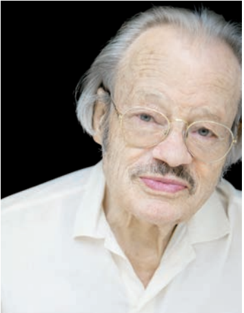
Friedrich Cerha (06. & 07.03.)

Le «prix Nobel de musique»: Le compositeur Friedrich Cerha, né le 17 février 1926 (prononcer Tsérha; voir les concerts des 06 et 07.05.2014), a reçu en 2012 le Prix Ernst von Siemens. En 1972/1973, Ernst von Siemens crée la fondation musicale qui porte son nom.