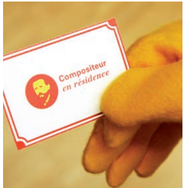
Tchaikowski, Compositeur en résidence

Der Nussknacker , die Klavierkonzerte N° 1 und N° 2 , der Blumenwalzer , die « Pathétique », die Symphonien N° 4 und N° 5 , Eugen Onegin ... Pjotr Iljitsch Tschairowsky nimmt in der Saison 2013/14 nicht nur einen festen Platz im Programm von OPL und Philharmonie ein, er macht es sich auch im Haus an der Place de l'Europe gemütlich. Und wie es sich für einen Compositeur en résidence gehört, steht er uns regelmäßig Rede und Antwort – zu sehen auf dem Blog der Philharmonie und ihrem YouTube-Kanal: www.youtube.com/PhilharmonieLux