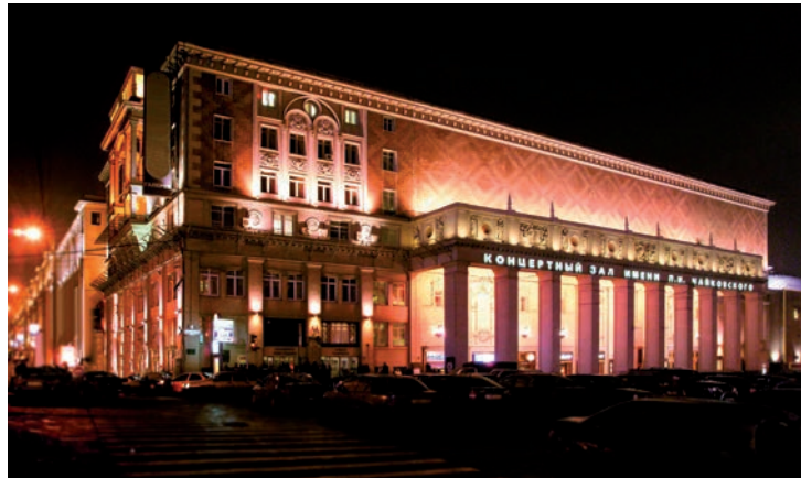
Moscou (12. & 13.04.)

Ces deux tournées sont un excellent moyen de promouvoir l'orchestre et le Luxembourg à l'étranger, comme l'ont démontré les échos élogieux parus dans la presse à la suite des derniers déplacements de l'OPL: «L'orchestre a su montrer de manière persuasive qu'il dispose non seulement d'une finesse sonore d'exception, mais aussi de réserves d'énergie des plus impressionnantes.» ( Münchener Abendzeitung , 2015)