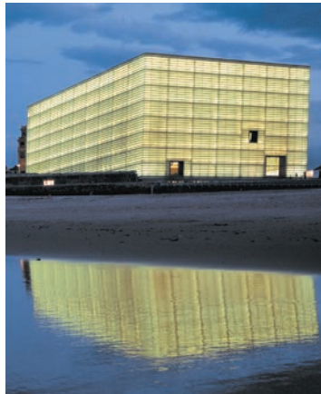
San Sebastián (04.02.)

2014 est pour l'OPL une année de voyages. Dès fin janvier, l'orchestre est ainsi mobilisé pour une tournée de cinq concerts en Espagne, avec au programme les villes de Logroño, Murcia, Alicante, San Sebastián et Zaragoza, reconnues pour la qualité de leurs salles de concerts. L'OPL, placé sous la direction d'Emmanuel Krivine, accueillera le soliste Nikolai Lugansky, pianiste avec lequel l'orchestre entretient une grande complicité depuis plusieurs années. Le programme s'articulera autour du Concerto pour piano et orchestre N° 2 de Chopin avec, selon les villes, la Symphonie N° 5 de Chostakowitch ou la Symphonie N° 4 de Brahms.