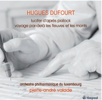
CD Timpani (1C1195)

Der Nussknacker , die Klavierkonzerte N° 1 und N° 2 , der Blumenwalzer , die « Pathétique », die Symphonien N° 4 und N° 5 , Eugen Onegin ... Pjotr Iljitsch Tschairowsky nimmt in der Saison 2013/14 nicht nur einen festen Platz im Programm von OPL und Philharmonie ein, er macht es sich auch im Haus an der Place de l'Europe gemütlich. Und wie es sich für einen Compositeur en résidence gehört, steht er uns regelmäßig Rede und Antwort – zu sehen auf dem Blog der Philharmonie und ihrem YouTube-Kanal: www.youtube.com/PhilharmonieLux