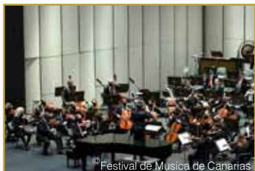
© Festival de Musica de Canarias Au programme: U.Chin -S.Rachmaninov-C.Franck