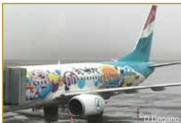
Le bel oiseau qui nous emmena aux Canaries