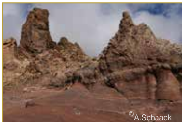
Les îles Canaries, voyage inhabituel avec les Amis de l'OPL