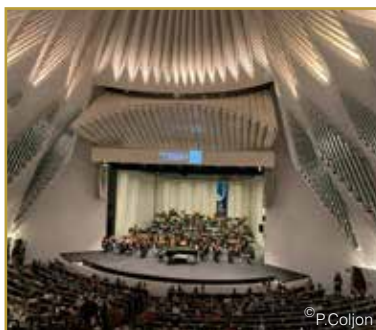
Un concert réussi et apprécié par le public