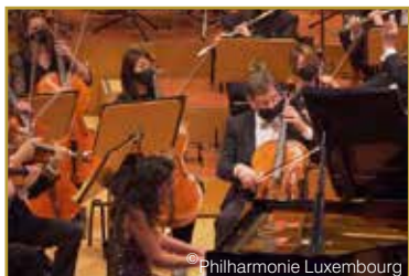
La merveilleuse Béatrice Rana accompagnée par l'OPL dirigé par maestro Gustavo Gimeno